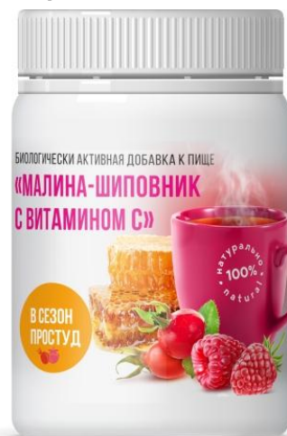
Мед, малина, шиповник и Витамин С

Состав: мед сухой, фруктоза, экстракт сухой плодов малины, экстракт сухой плодов шиповника, антиокислитель (аскорбиновая кислота).