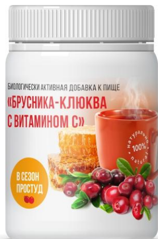
Мед, брусника, клюква и Витамин С

Отличное профилактическое средство - на основе натуральных компонентов с витамином С, которые предназначены для применения в период сезонных простудных заболеваний, даже если вы еще не заболели, но ощущаете первые признаки ОРВИ.