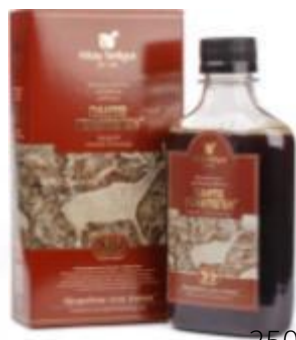
250 мл./100 мл.

Пантогематоген – эликсир молодости и здоровья! Это сильнейший адаптоген на основе крови горных оленей – маралов, добытой безвредным для животного способом во время активного роста рогов-пантов. Кровь марала содержит 18 аминокислот из 20, которые встречаются в природе, а также различные макро- и микроэлементы. Пантогематоген оказывает воздействие на организм человека, стимулируя работу всех жизненно важных систем: замедляет процесс старения организма, стимулирует кроветворение при анемии, увеличивает половую потенцию, повышает умственную и физическую работоспособность, снижает уровень холестерина в крови, улучшает память и работу мозга, повышает сопротивляемость к простудным заболеваниям, восстанавливает и укрепляет иммунитет.