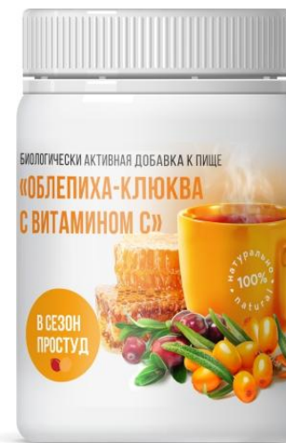
Мед, облепиха, клюква и Витамин С

Состав: мед сухой, фруктоза, экстракт сухой плодов малины, экстракт сухой плодов шиповника, антиокислитель (аскорбиновая кислота).